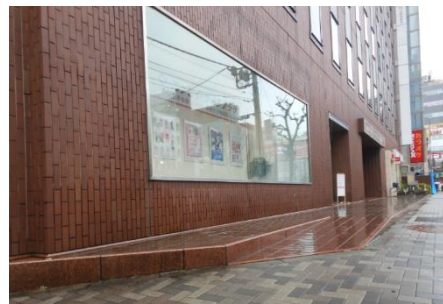
正面玄関の左横に車椅子用スロープがありますのでご利用ください

※本件に関するご質問等はメール ( dennoshin@hke.jp ) にてお問い合わせください。 ※お申し込みや問い合わせを頂く前に、当社「個人情報保護方針」をご一読頂き、当社の個人情報の取扱にご同意頂いた上で、ご送信頂きますようお願い致します。 個人情報保護に関して : https://www.hke.jp/privacy/privacy.htm